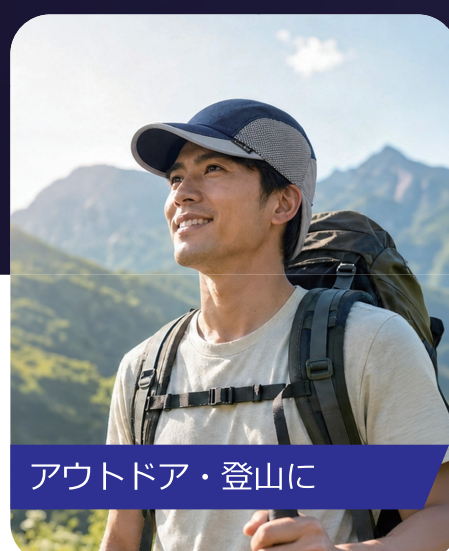
アウトドア・登山に