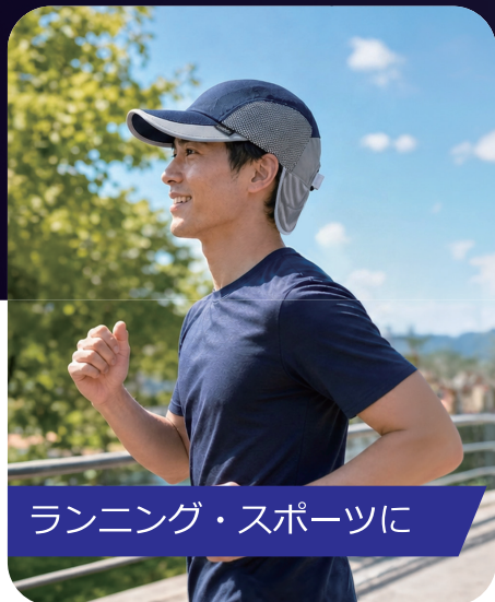
ランニング・スポーツに