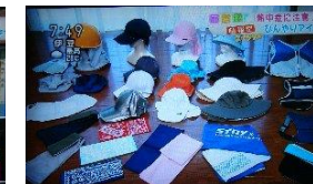
新商品の 暑さ、熱中症対策ベスト、クールビット・アイスポケットベストや弊社商品を放映紹介