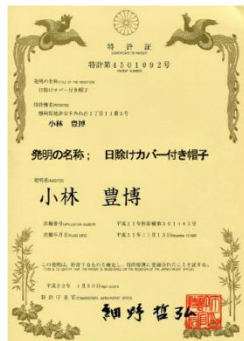
クールキャップ特許証

(株)日曜発明ギャラリーは少量販売でも、何らかの産業財産権を確保して 開発、販売活動に臨んでいます。