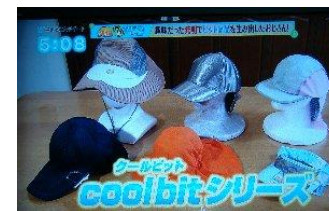
暑さ対策で有名な熊谷市が3歳児全員にcoolbit KIDS キャップを配布