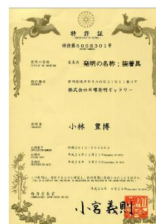
熱中症対策ベスト特許証