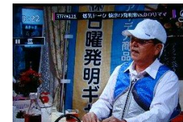
暑さ対策の発明品、スポーツ観戦用にクールビットキャップ、ベストが話題に！

■2016年8月31日(水) 朝日テレビ静岡 情報番組 「今年暑かった出来事」、ポケモン、 オリンピック静岡県勢活躍、暑さ対策商品