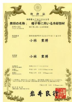
クールバイザー特許証