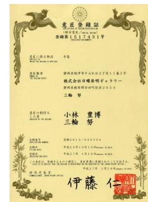
意匠権登録証第1517431号