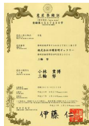
意匠権登録証第1517430号

もう少しで、ヒット商品に出来る可能性のある商材です。(バリエーション展開も可能) 一緒に新市場へ新商品を独占付で世に出してみませんか？