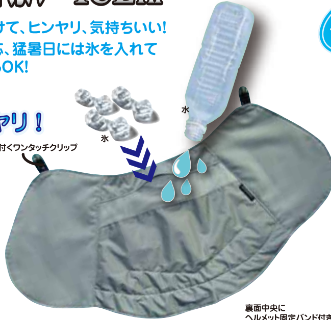
裏面中央にヘルメット固定バンド付き

coolbit®メットカバー・アイスイン 本体価格(税別) 品番 2,950円 CBMC-ICE(シルバー) ●材質/中央部ナイロン100% 両側部ポリエステル100% ●寸法/約460×230×4mm ●重量/40g