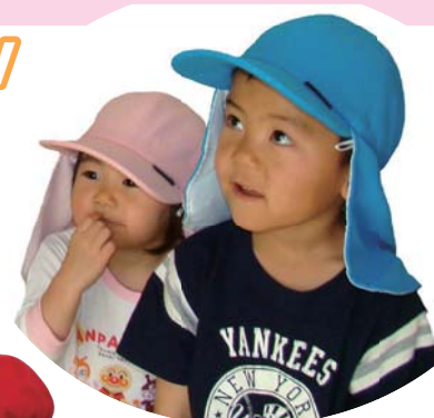
De 2 a 10 años de edad.