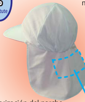
Parche coolbit® Parte posterior.