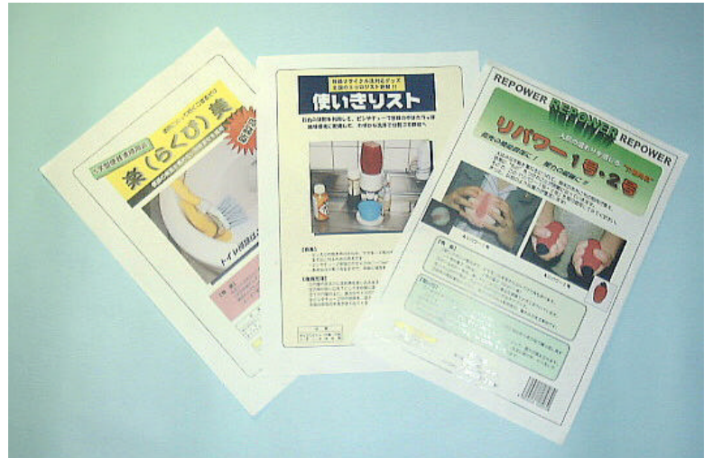
簡易カタログの制作例 (ネーミング貸し出し方式もあります)