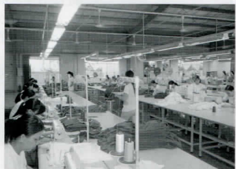
クールビットキャップのベトナム工場 (縫製工場の一部)

家内と一緒に、ベトナムに行きました。この工場は韓国資本が入っており、韓国料理で歓待されました。製造現場はずいぶんグローバルなのだと感心しました。